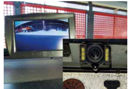
Rückfahrkamera mit Monitor

Ausgehend davon und unabhängig vom laufenden Wettbewerb der LEAG im Monat März „Sicher auf allen Wegen“, bei dem sich auch die Mitarbeiter der GMB ausdrücklich einbringen können, wird die GMB in diesem Jahr die „Idee des Jahres“ küren. Dabei sind Vorschläge zur Optimierung von betrieblichen Prozessen den Ideen zur Reduzierung bzw. Vermeidung von Gefährdungen gleich-