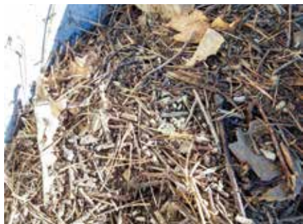
Nestmaterial mit Ameisen und Puppen

Die Hügel dieser Waldameisen befinden sich in Misch- & Nadel-Wäldern, je nach Art an sonnigen Waldrändern oder auf Waldschneisen. Der oberirdische Nestteil besteht meist aus Kiefern- oder Fichtennadeln. Das Nest reicht jedoch tief ins Erdreich hinein, wo sich Kammern mit verschiedenen Funktionen befinden: für Königinnen, Eier, Larven, Puppen, Abfall, etc. Als Nestkern, in dem die Königinnen vor Fressfeinden geschützt sind, nutzen die Kahlrückige und die Rote Waldameise gern Totholz oder Baumstubben. Die Wiesen-Waldameise hingegen baut ihre verzweigten unauffälligen Nester mit geringer Abdeckung meist ausschließlich in sandigen Boden.