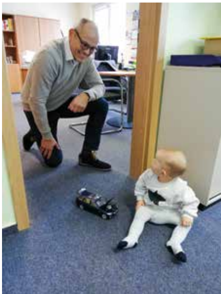
Nachwuchsförderung fängt früh an

Statt Corona habe ich lieber ein kleines GMB-Faschingsfieber