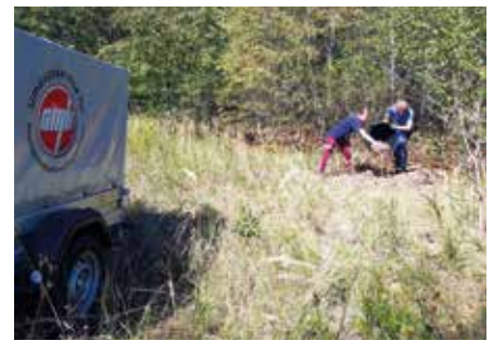
Ameisenheger im Einsatz

Durch die Mithilfe bei einer Umsiedlungsaktion eines Nachauftragnehmers konnten wir bereits Erfahrung sammeln – hier waren starker Körpereinsatz und Ausdauer bei der Bergung eines besiedelten Baumstubbens erforderlich. Unsere erste eigene Umsiedlung mit Hängereinsatz stellte uns aufgrund